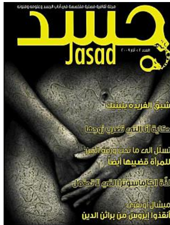
Considéré comme pornographique, le magazine a provoqué au Liban la colère des autorités religieuses.